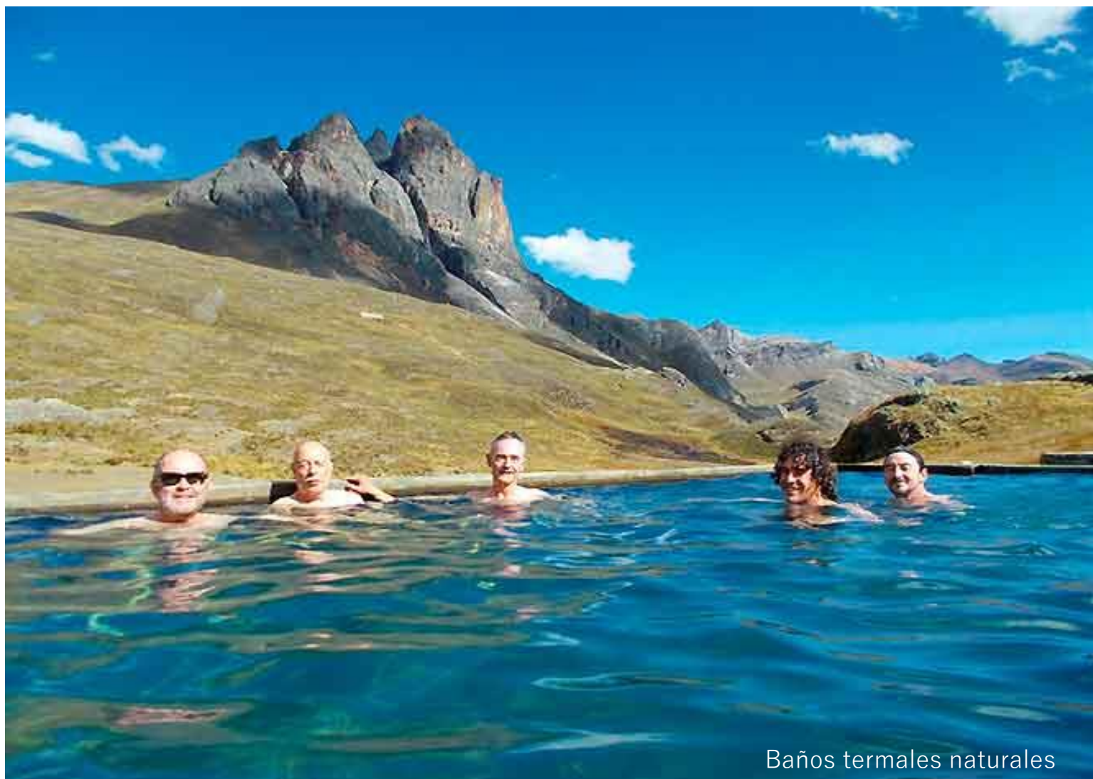
Baños termales naturales

20/4 : Día final del trekking, iniciamos ascendiendo hasta los 4800 m. del paso Portachuelo de donde tendremos una vista excepcional de la cordillera de Raura y sus varias montañas nevadas superiores a 5 mil metros. Iniciamos el descenso hasta la cabecera de la gigantesca laguna Surasaca 4400 m. 4 - 5 hs aprox. Allí nos espera nuestro transporte para volver al poblado de Churín (2200 m.) de donde tomaremos un bus hacia Lima.