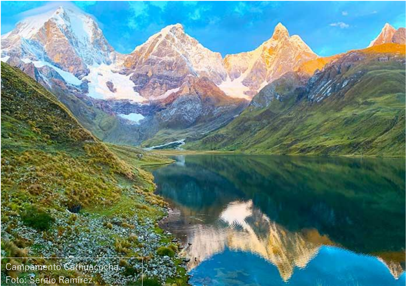
Campamento Carhuacocha.

□ TREKKING CORDILLERA DE HUAYHUASH - CHURIN RUTA CLÁSICA - 6 DÍAS