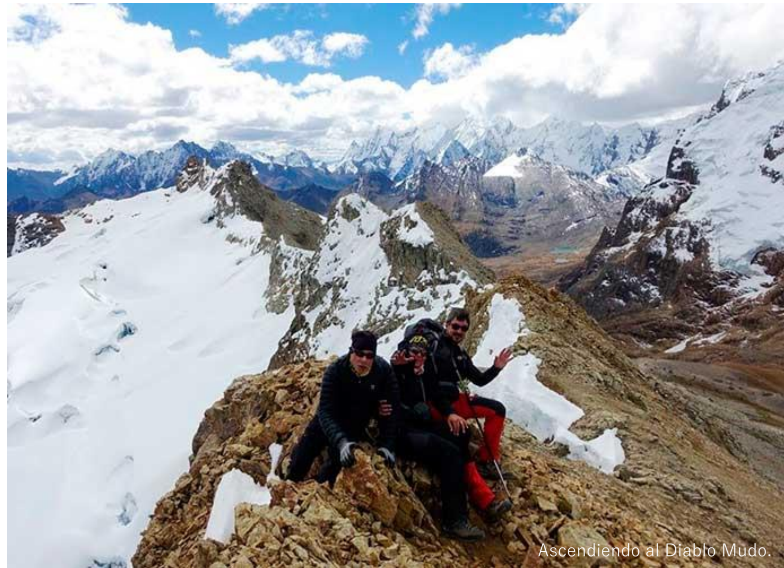
Ascendiendo al Diablo Mudo.