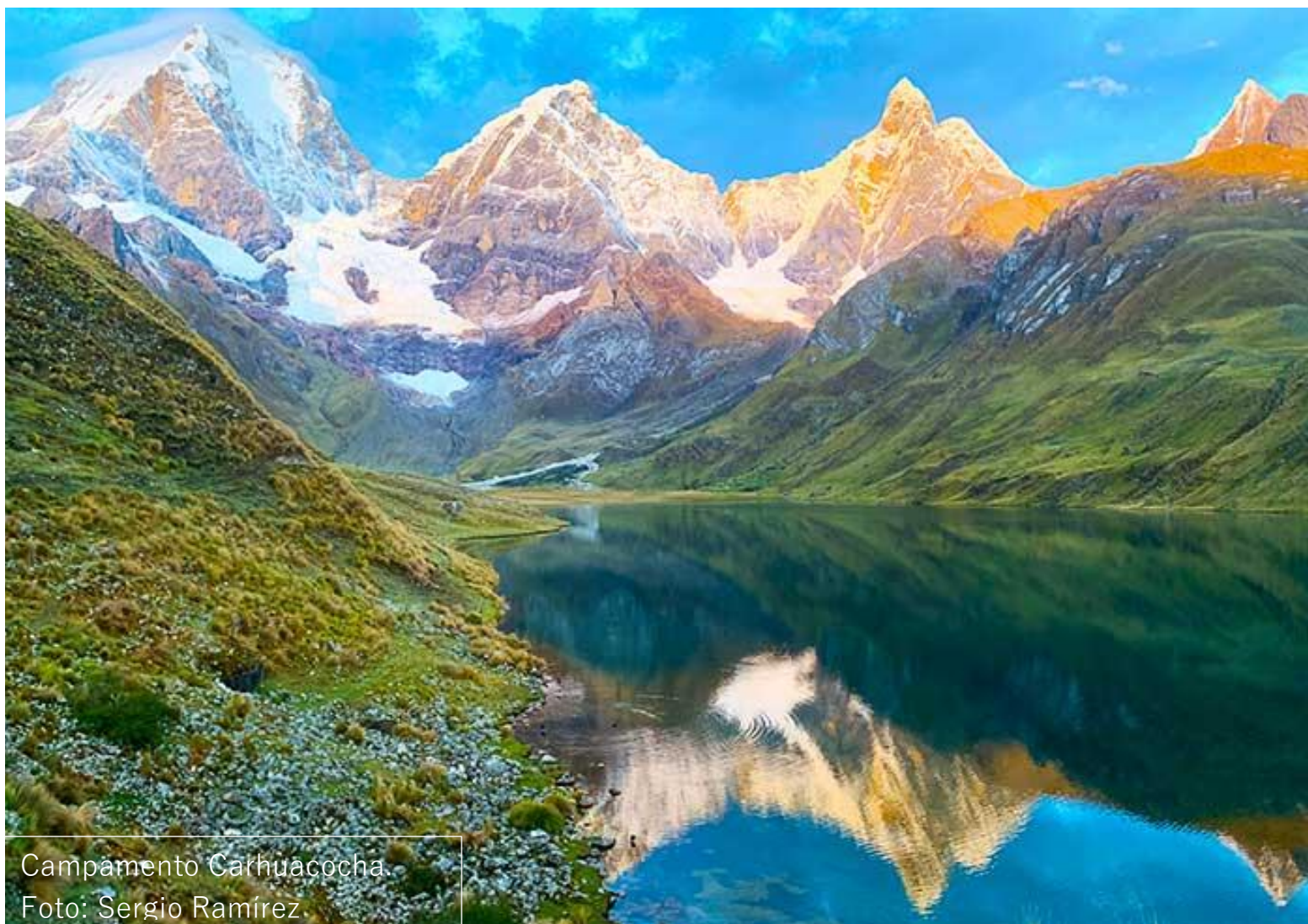
Campamento Carhuacocha.

□ TREKKING CORDILLERA DE HUAYHUASH RUTA CLÁSICA Y ASCENSO AL NEVADO DIABLO MUDO 5350 m. – 11 DÍAS