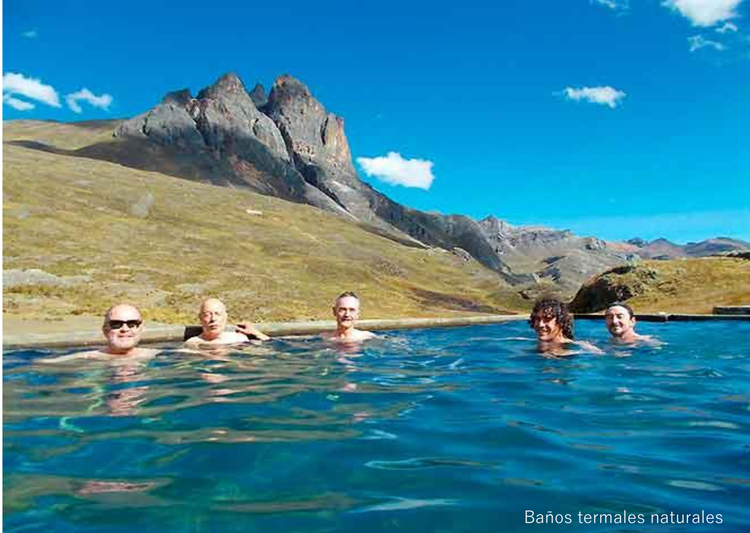
Baños termales naturales

Día 7: Este día alcanzaremos la zona más “baja” del trekking, iniciando el día en descenso hasta llegar a los 3500 m. del poblado de Huayllapa, lugar muy típico de las zonas alto andinas del Perú y de donde son oriundos algunos arrieros. La visita del pueblo es opcional, ya que debemos continuar el trekking hasta los 4250 m. de nuestro campamento llamado Huatiac. 4 - 6 hs. aproximadamente.