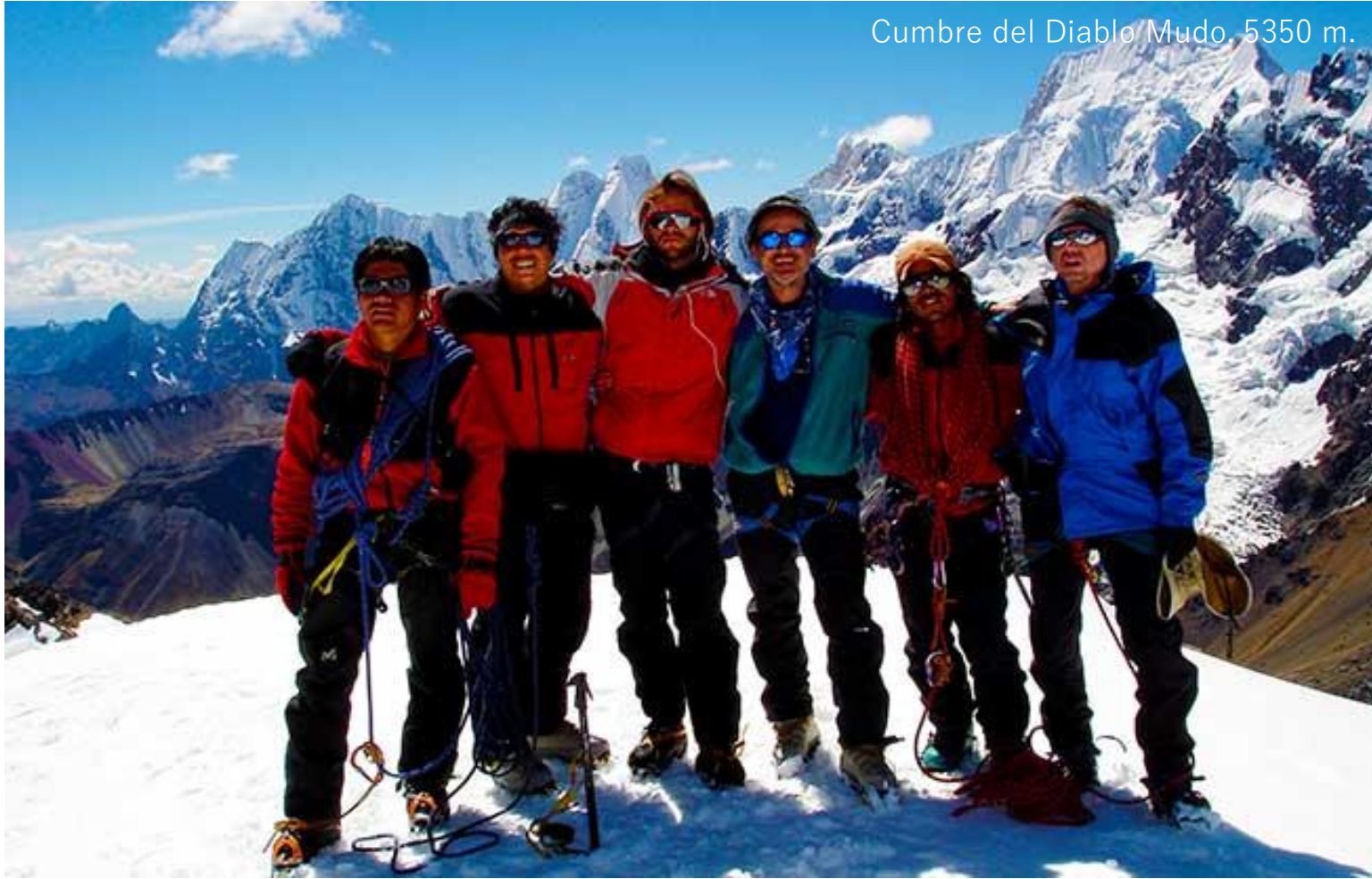
Cumbre del Diablo Mudo, 5350 m.